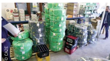
CAZE a organisé une journée Qofil le 15 mai dernier : quelque 11 km de gaines préfilées ont été vendues rien qu'au cours de la matinée !

fils dans une même gaine, je pourrais trouver ces produits spécifiques chez Qofil. »