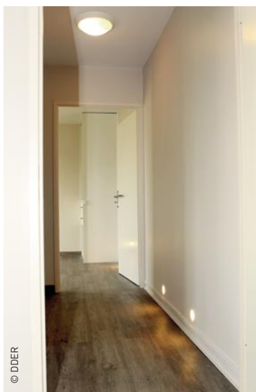
Chemin lumineux réalisé avec les gaines préfilées Qofil dans un logement pour personne à mobilité réduite.

« L'installation de gaines électriques préfilées de marque Qofil en courant fort, comme en courant faible, me fait gagner énormément de temps, admet Dominique Desachy. Si je devais prendre une gaine vendue initialement vide et y enfiler des fils, ce serait très long. Avec la solution Qofil, les fils sont déjà logés dans la gaine. » Également intéressant chez Qofil, la disponibilité d'une large gamme de gaines préfilées, depuis l'ICTA (isolant cintrable transversalement annelé) de diamètre de 16 mm à 40 mm. « Je fais usage des produits standards du catalogue Qofil (ICTA 16 et 20, en 2, 3, 4 ou 5 fils de différentes couleurs) pour la commande des interrupteurs ou des va-et-vient, pour l'alimentation du chauffage électrique, des machines à laver ou du sèche-linge, comme pour l'éclairage en respect de la norme NF C 15-100, explique Dominique Desachy. Pour des cas particuliers nécessitant des fils de même couleur ou un plus grand nombre de